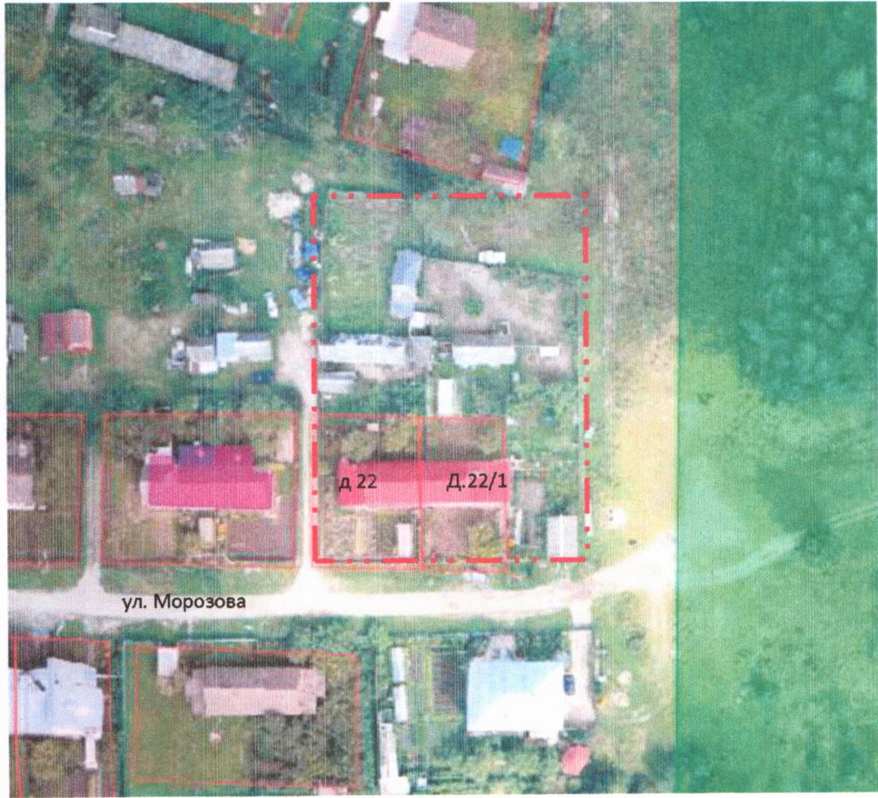
Схема границ подготовки инженерных изысканий

----- граница производства инженерных изысканий